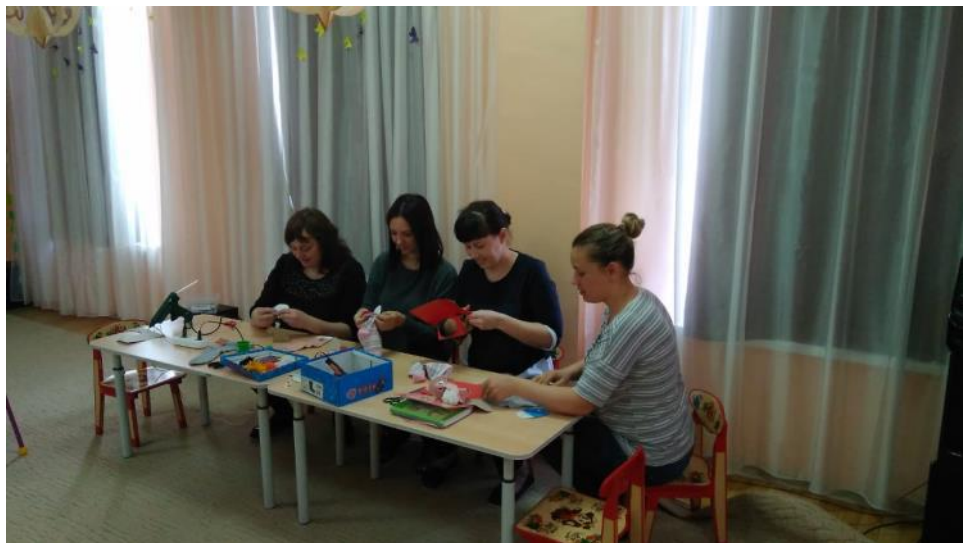
Мастер- класс по изготовлению перчаточных кукол