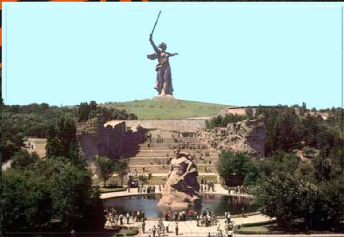
МОНУМЕНТ «РОДИНА-МАТЬ ЗОВЁТ!»

Подвиг защитников Сталинграда известен всему миру. Именно здесь в 1942-1943 годах решалась дальнейшая судьба планеты. Для гитлеровцев этот город имел особое значение не только, как важный военно-политический, экономический и транспортный центр. Они прекрасно понимали, что город, где возшла звезда Сталина, город- символ, носящий его имя, играет ключевую роль в патриотическом сознании советского народа.