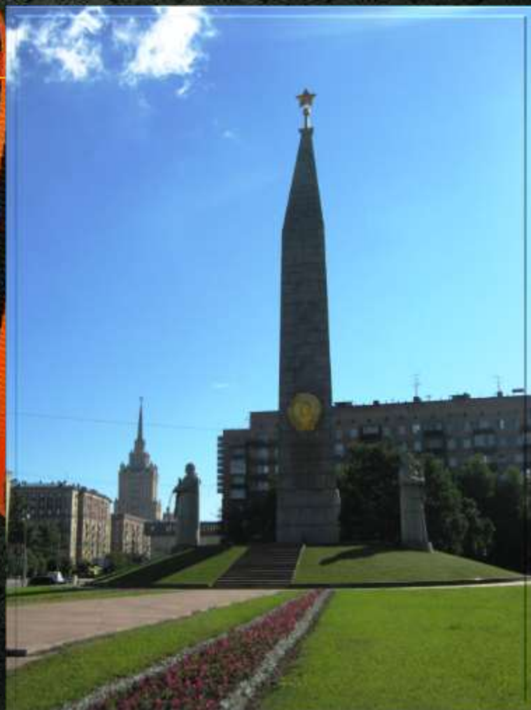
ОБЕЛИСК «ГОРОДУ-ГЕРОЮ МОСКВЕ»