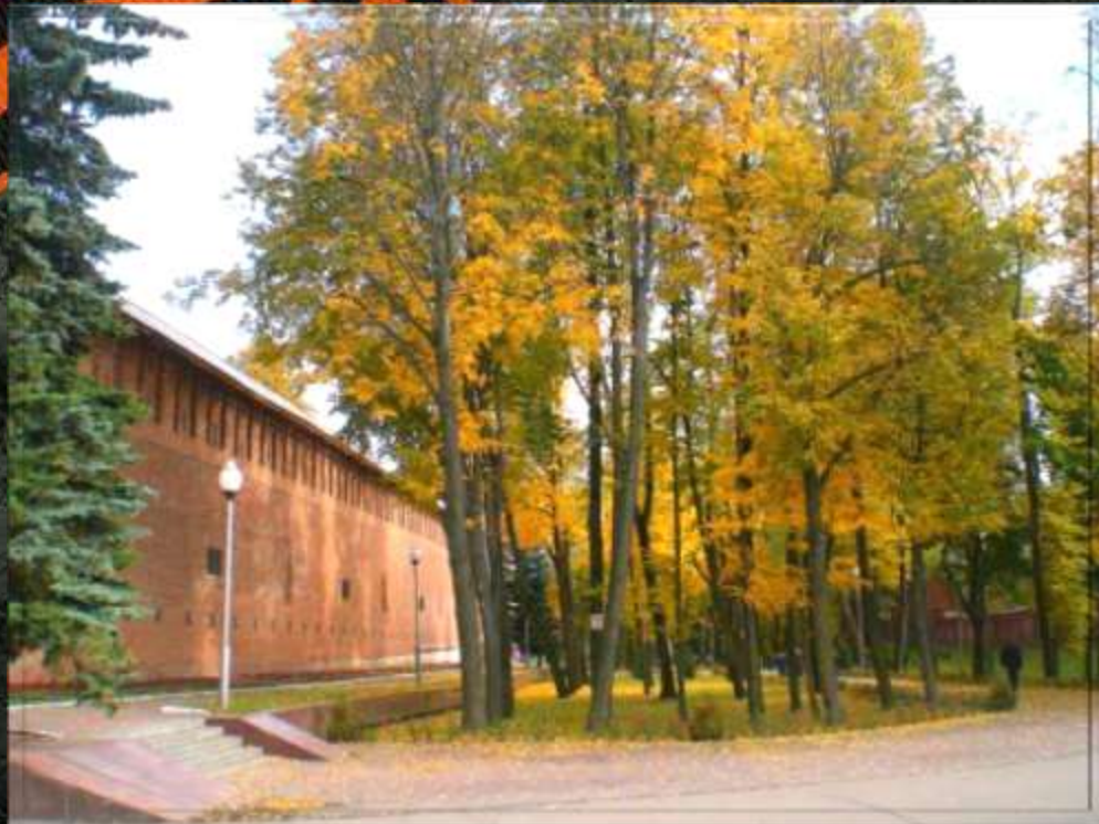
СКВЕР ПАМЯТИ ГЕРОЕВ

Смоленское сражение продолжалось два месяца с 10 июля по 10 сентября 1941 года. В результате сражения был сорван гитлеровский план «молниеносной войны». Высшая степень отличия «Город- герой» с вручением ордена Ленина и медали «Золотая Звезда» присвоена городу Смоленску в 1985 году за массовый героизм и мужество его защитников, проявленные в борьбе за свободу и независимость Родины в Великой Отечественной войне