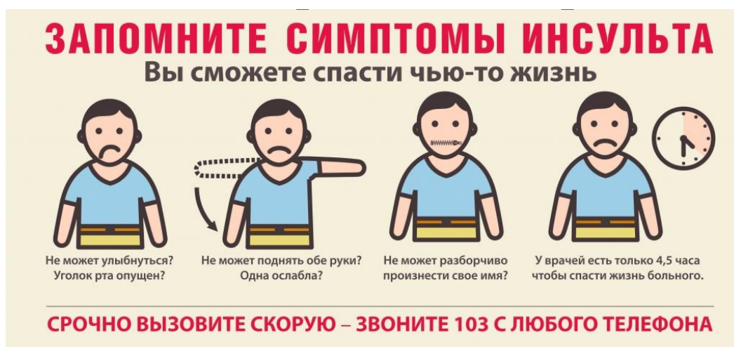
Рисунок 1. Симптомы инсульта

Иллюстрации каждого приложения обозначают отдельной нумерацией арабскими цифрами с добавлением перед цифрой буквы приложения. Например, Рисунок А.3. При сквозной нумерации, ссылаясь на иллюстрацию, следует писать «... в соответствии с рисунком 2».