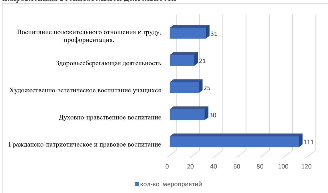
Диаграмма 4. Общее количество мероприятий, проведенных за 2020-2021 учебный год по направлениям воспитательной деятельности

Из данных таблицы и диаграммы видно, что наибольшее количество мероприятий было проведено в таких направлениях работы, как гражданско-патриотическое и духовно-нравственное воспитание. Снизилось количество мероприятий в художественно-эстетическом направлении в связи с переходом на дистанционную форму обучения.