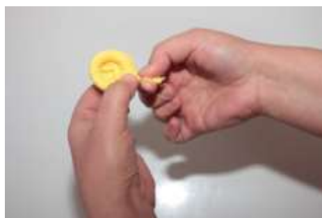
4. Полученную заготовку захватить с краёв, закрутить как конфетку и обрезать хвостик.