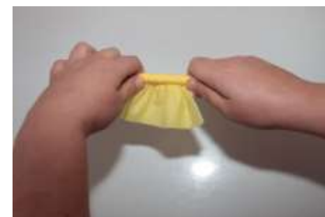
3. Сжимаем салфетку с двух краев к центру и снимаем с карандаша.