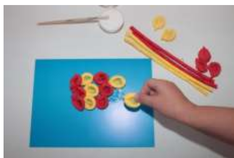
7. Начинаем собирать нашу рыбку.