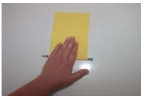
2. Салфетку плотно наматываем на карандаш.