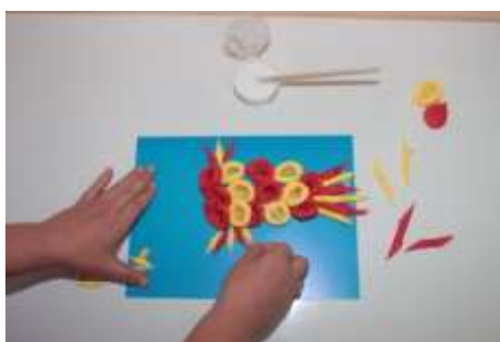
8. А теперь хвост и плавники.