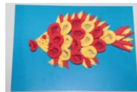
9. Вот и готово!