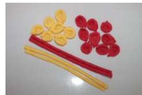
6. По такому принципу собираем необходимое количество заготовок.