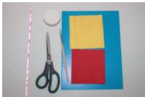
1. Подготовка материала для работы.