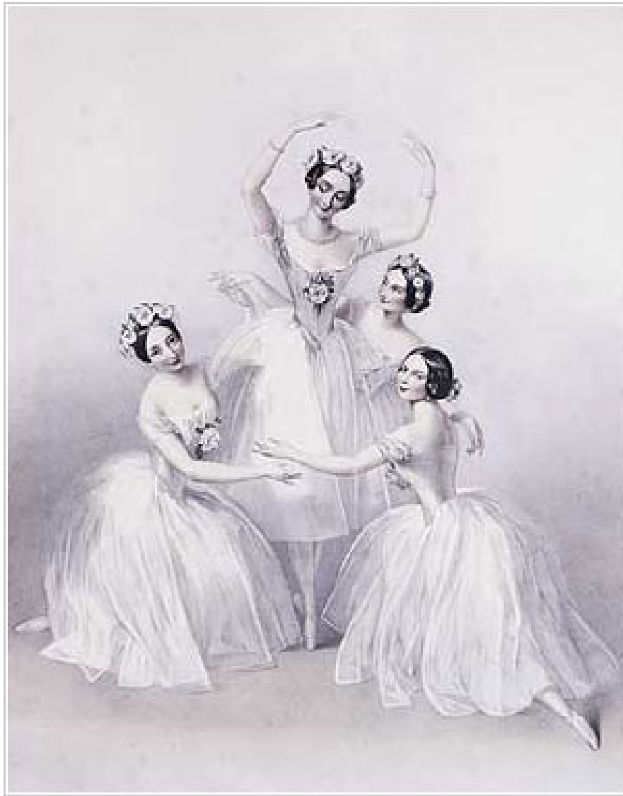
Шарлотта Гризи , М. Тальони, Люсиль Гран и Фанни Черрито на литографии Шалон , Лондон, 1845