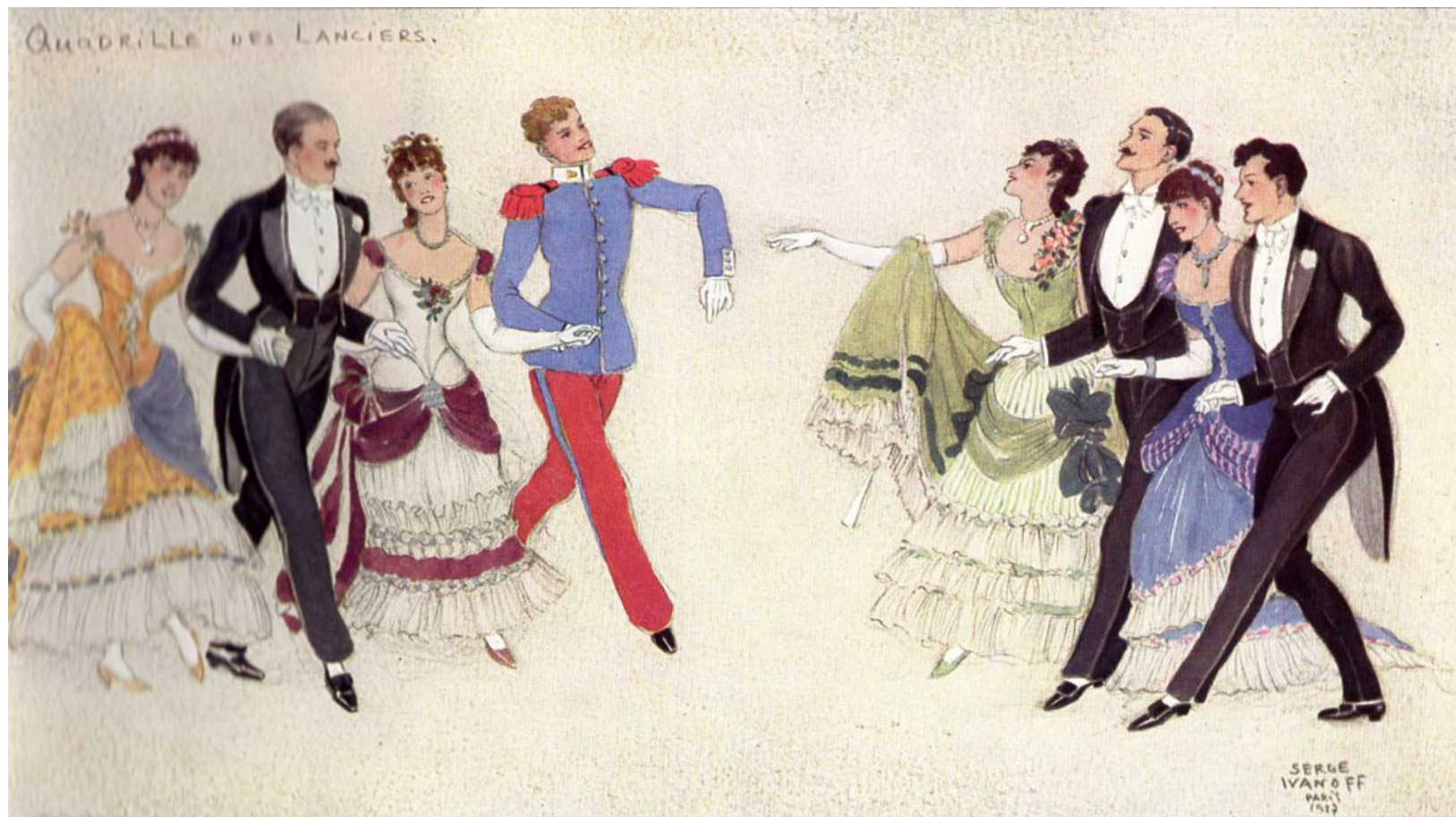
Французская кадрили 19 век