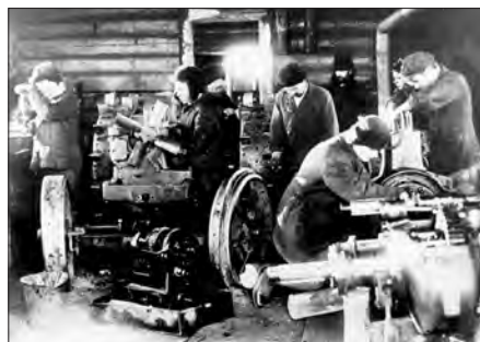
В мастерской Колчеданской МТС

За лучшее проведение весеннего сева 1944 г. решением Исполкома