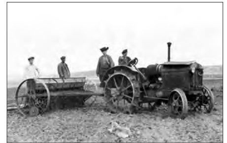
Колхоз «Победа» готовится к севу. 1941–1945 гг.