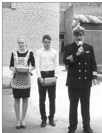
На линейке в честь присвоения школе имени Героя. 2019 г.