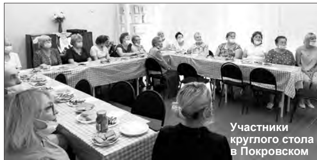
Участники круглого стола в Покровском

В 2021 г. на территории Каменского района и Каменска-Уральского при грантовой поддержке областного министерства образования начал реализовываться социальный проект по патриотическому воспитанию граждан «Связь поколений».