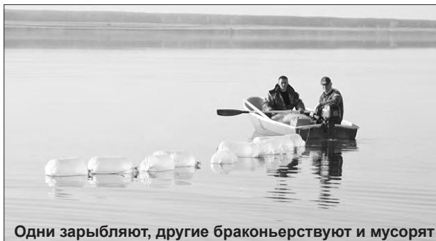
Одни зарыбляют, другие браконьерствуют и мусорят