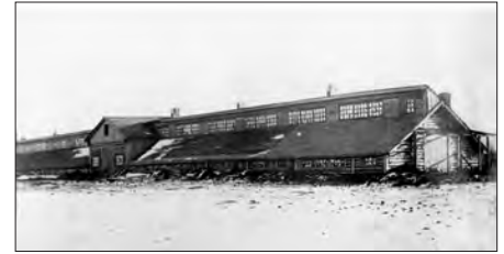
Свинарник в селе Колчедан

Несмотря на трудности, в 1944 г. Каменский район оказал помощь колхозам освобожденных районов, куда послано