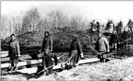
На строительстве парников. 1942 г. Колхоз «Новая жизнь» (Мартюш)