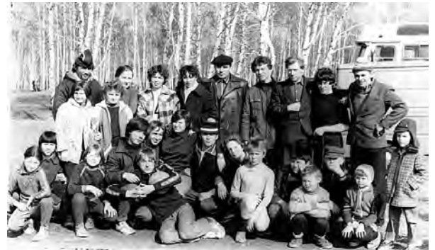
Молодежь на спортивной мероприятии