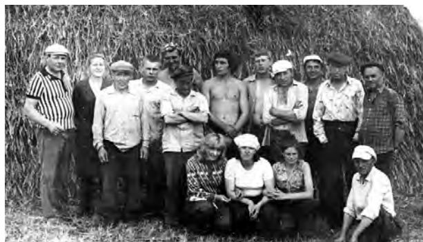
Рабочие МТМ на заготовке кормов