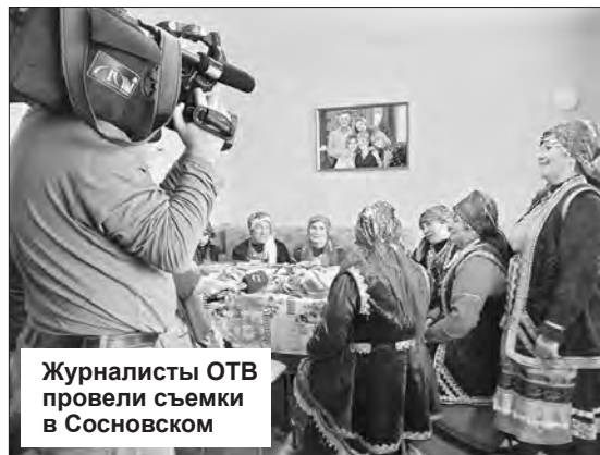
Журналисты ОТВ провели съемки в Сосновском

Е.П. Семибратская, библиотечка Сосновской библиотеки