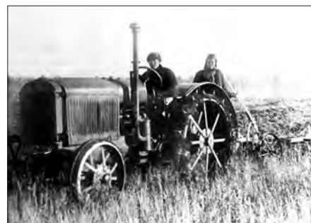
Первый колесный трактор ЧТЗ в Колчедане. 1934 г.