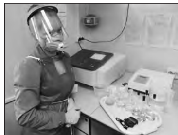
В лаборатории предприятия

карьера. Следующий этап – в 2022 г. снятие плодородного слоя почвы под объектами строительства и ее складирование для будущей рекультивации земель. Параллельно приступим к созданию производственной инфраструктуры и санитарно-бытового корпуса