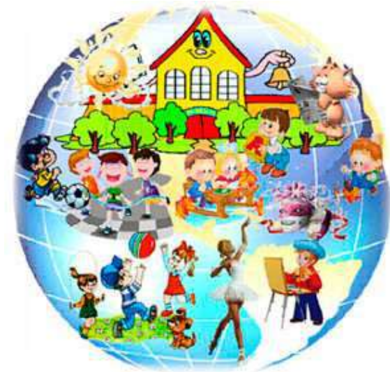
Объект ( школа)