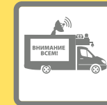
ПОДВИЖНЫЕ ЗВУКОУСИЛИТЕЛЬНЫЕ УСТАНОВКИ