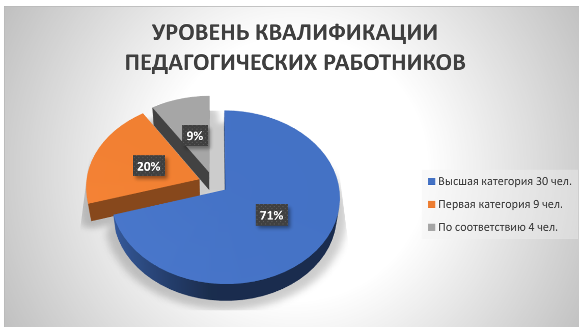
Рисунок 4- диаграмма, отражающая уровень квалификации педагогических работников

ДМШ № 1 является некоммерческой организацией, созданной для оказания услуг в целях обеспечения реализации дополнительных (предпрофессиональных и общеразвивающих) программ в области музыкального искусства.