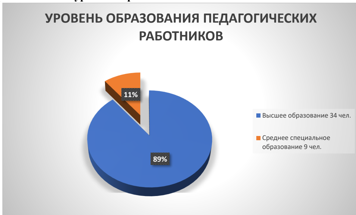
Рисунок 3- диаграмма состава педагогических работников по уровню образования

На рисунке 3 представлена диаграмма состава педагогических работников по уровню образования: