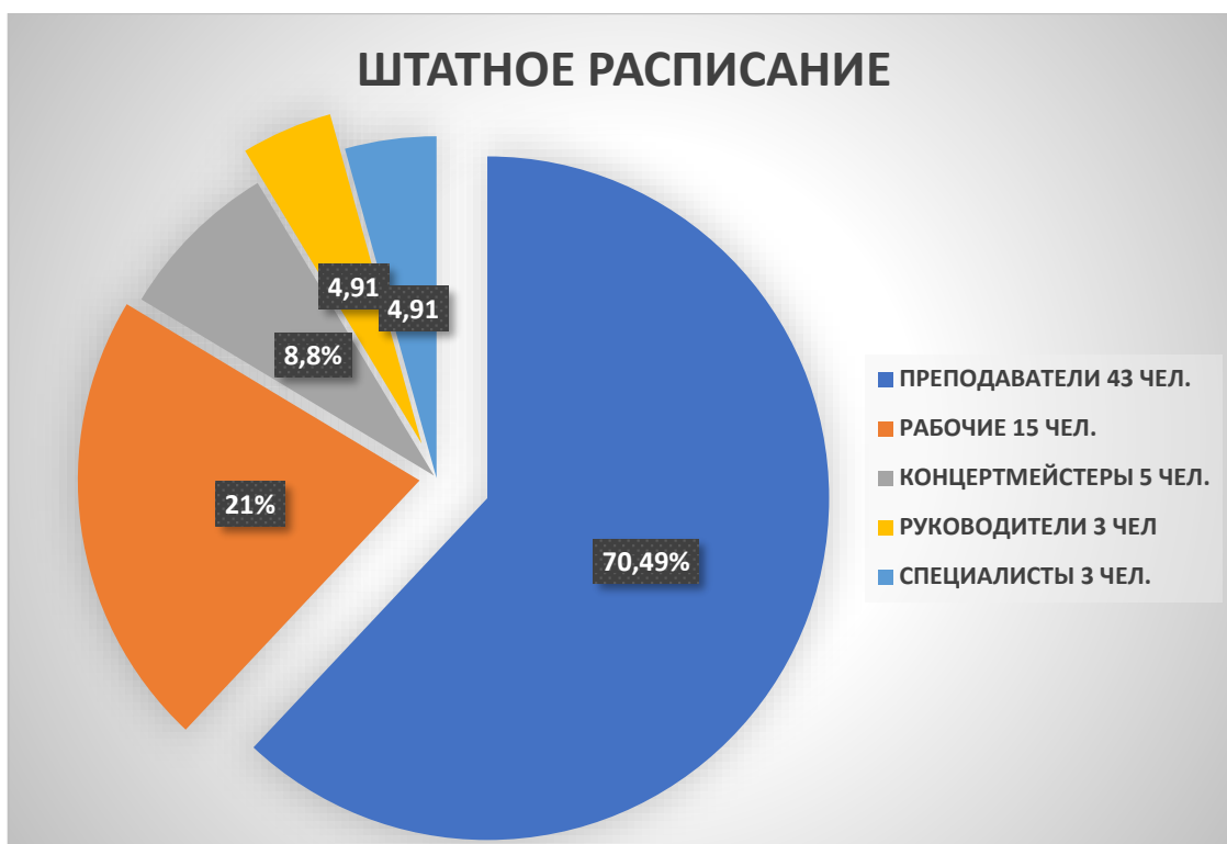
Рисунок 1- диаграмма штатного расписания

На рисунке 2 представлена диаграмма возрастного состава сотрудников: