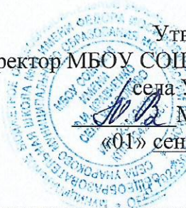
График работы педагогов дополнительного образования школьного спортивного клуба «Олимп» МБОУ СОШ №16 им. Ф.И. Кравченко села Унароково на I полугодие 2020-2021 уч.г.